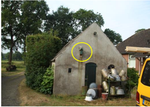
Deze nestkast is geschikt voor koolmees en pimpelmees om een nestplaats in te bezetten (gele cirkel).

Door het slopen van bebouwing, het verwijderen van de nestkast en het verwijderen van de struiken tijdens de voortplantingsperiode, wordt mogelijk een jonge vogel gedood en een bezet vogelnest beschadigd of vernield. Als gevolg van het uitvoeren van de voorgenomen activiteiten neemt de betekenis van het plangebied als foerageergebied voor vogels niet af.