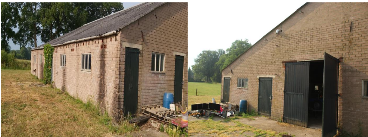
Amfibieën kunnen een (winter)rustplaats bezetten onder spullen/materialen in de buitenruimte.

Tijdens het veldbezoek zijn geen amfibieën waargenomen, maar gelet op de inrichting en het gevoerde beheer, wordt het plangebied als functioneel leefgebied voor sommige algemene en weinig kritische amfibieënsoorten beschouwd. Amfibieën als bruine kikker en gewone pad benutten het plangebied als foerageergebied en mogelijk bezetten ze er een (winter)rustplaats. Deze soorten kunnen een (winter)rustplaats bezetten in de oostelijke schuur, onder strooisel en bladeren en onder verspreide spullen/materialen in de buitenruimte. De oostelijke schuur is voor amfibieën toegankelijk en vormt een geschikte (winter)rustplaats. De overige bebouwing is voor amfibieën niet toegankelijk en vormt daardoor geen geschikte (winter)rustplaats. Het plangebied wordt niet als functioneel leefgebied van zeldzame amfibieënsoorten als kamsalamander, rugstreepad of poelkikker beschouwd. Geschikt voortplantingsbiotoop ontbreekt in het plangebied.