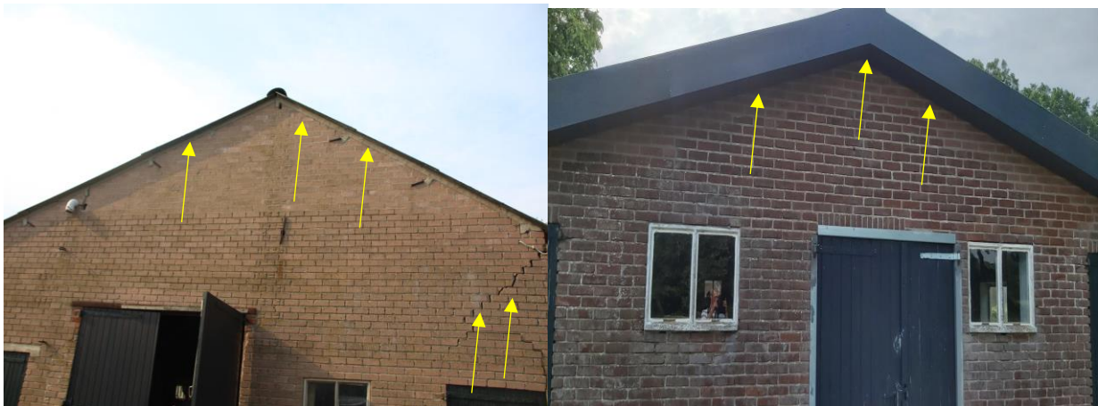
Foto links; aanwezigheid scheuren in gevel en de daklijsten sluiten strak aan op de buitengevels (gele pijlen). Foto rechts; de betimmering van het dakoverstek sluit naadloos aan op de buitengevels (gele pijlen).

Door het uitvoeren van de voorgenomen activiteiten wordt geen vleermuis verstoord of gedood en wordt geen vaste rust- of voortplantingsplaats verstoord, beschadigd of vernield.